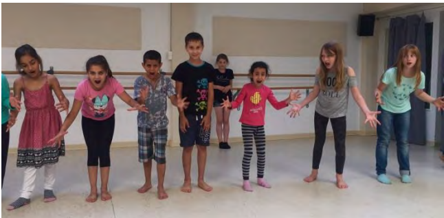
Biografisches Tanz- und Theaterprojekt

In Zusammenarbeit mit der Landesvereinigung Kulturelle Jugendarbeit NRW.